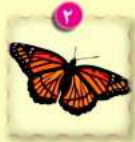
كن جميلًا! (نص شعري).