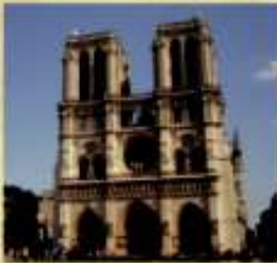
(جمال الكاتدرائية تكفي سؤال جواباً).

كلمة (نوتر دام) تعني بالفرنسية (سيدتنا) والمقصود بها العذراء مريم أم السيد المسيح عليه السلام. وقد أطلقت هذه الكلمة على كاتدرائية ضخمة في باريس بنيت عام ١١٦٣م في جزيرة بنهر السين وكاتدرائية نوتردام مشهورة بمبناها الرائع الجميل، الذي استغرق حوالي ١٥٠ سنة حتى فرغ منه البنائون والفنانون الذين أبدعوا في تصميمه وبنائه وزخرفته وتجميله.