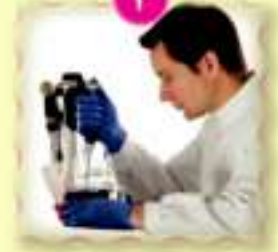
آيات العلم (نص شعري).