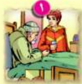
عِبَادُ الرَّحْمَنِ (قرآن كريم)