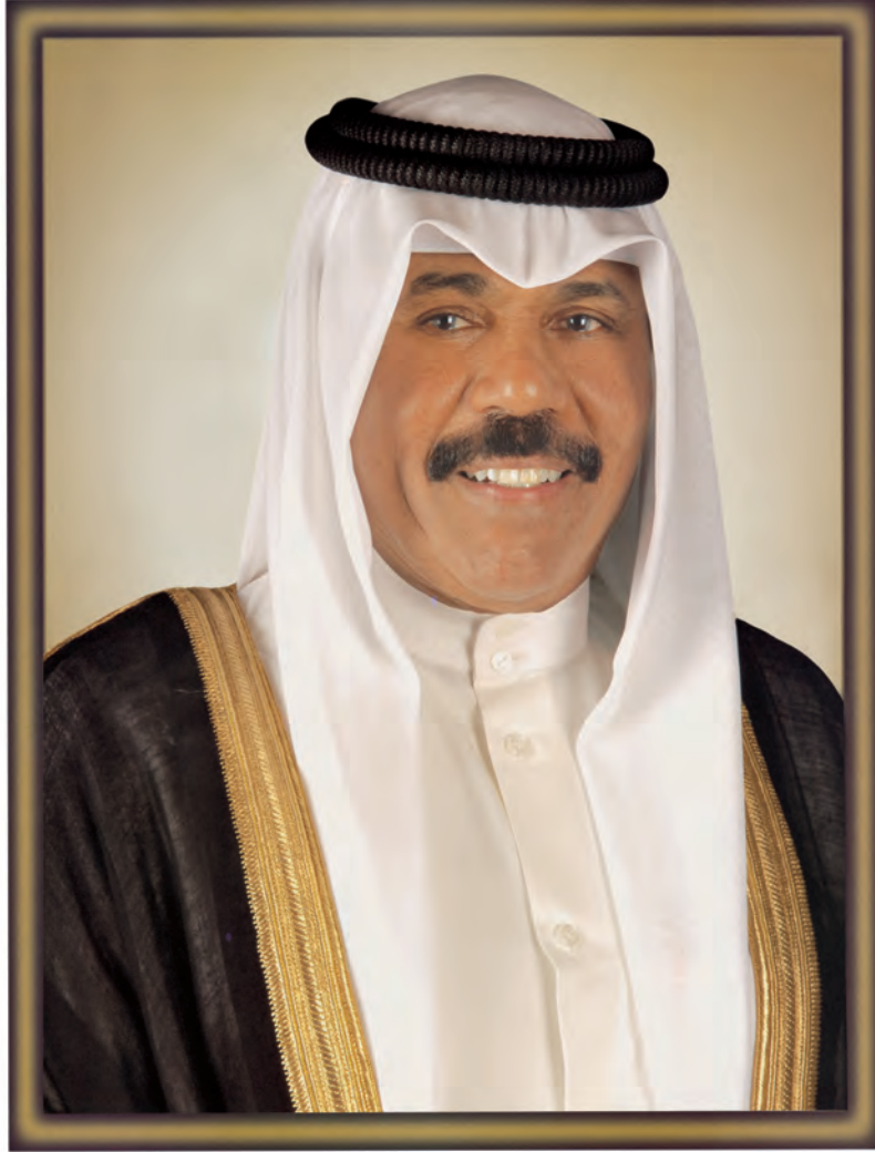
سَيِّدُ الشَّيْخِ نَوَافُ بْنُ عَبْدِ الْوَائِلِ السَّبَّاحِ وَلِيَّ عَهْدِ دَوْلَةِ الْكُوَيْتِ