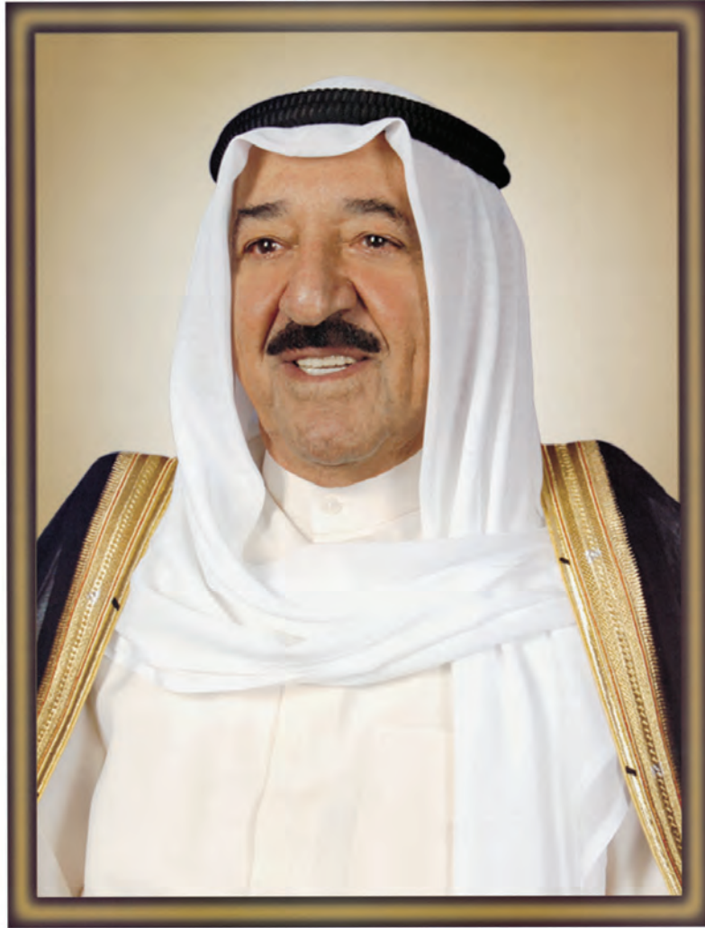
صَلَّى السُّلْطَانُ الشَّيْخُ صَبَّاحُ الْأَخِيذِ الْجَابِرِ الصَّبَّاحُ أَمِيرُ دَوْلَةِ الْكُوَيْتِ