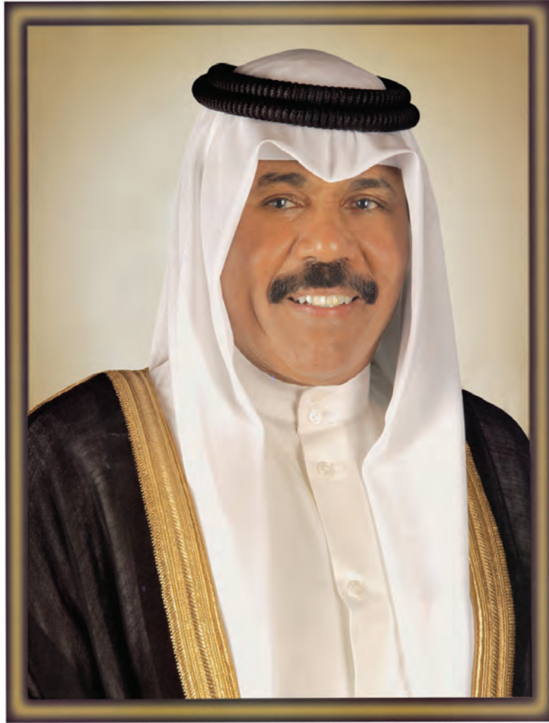
سُيُومُ الشَّيْخِ نَوَافٍ ابْنِ عَبْدِجَلِيلِ بْنِ الصَّبَاحِ وَلِيِّ عَهْدِ دَوْلَةِ الْكُوَيْتِ