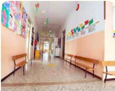
جولة حون المدرسة

فناء المدرسة. حان وقت الصيد! سيأخذك المعلم في جولة حول المدرسة. لاحظ أي دليل على الاهتمام بالبيئة المدرسية.