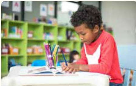
طالِبٌ يَرَسِمُ قِصَّةَهُ

ازيسم صورةً للقصّة التي تُريدُ سرّدها عن أحدِ جَوَابِ تَرَائِكِ. تَدَكِّرُ إِذْرَاجَ أَكْبَرَ قَدْرٍ مُمَكِّنٍ مِنَ التَّفَاصِيلِ لِأَنَّ ذَلِكَ سَيُسَاعِدُكَ عِنْدَ مُشَارَكَةِ الْقِصَّةِ مَعَ طَلِبَةِ الصَّفِّ.