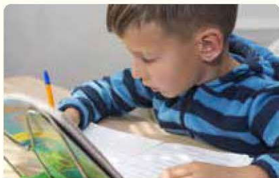
طالب يكتُب قصة