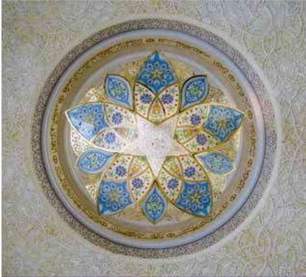
مستوحى من جامع الشيخ زايد الكبير، أبوظبي

تصميم يعكس مفاهيم الثقافة المحلية والمجتمع المعاصر والمواطنة العالمية.