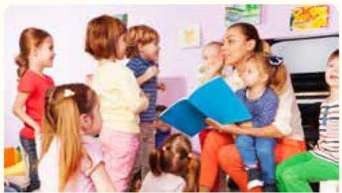
خان وقت القصة

هناك أنواع كثيرة مختلفة من القصص. كم نوعًا مختلفًا منها يمكنك تسميته؟ هل يمكنك إعطاء بعض الأمثلة لأنواع المختلفة من القصص؟