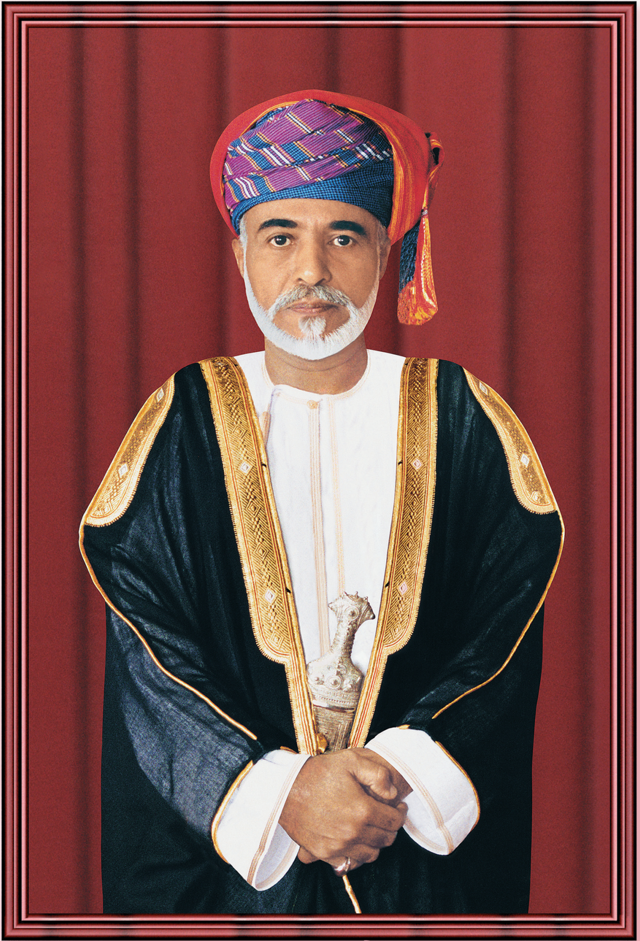
حضرة صاحب الجلالة سلطان فابوس بن سعيد المعظم