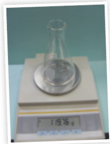
قراءة الميزان = ١١٩,٧٦ جرام