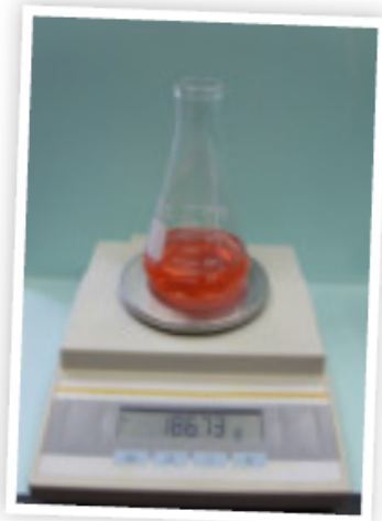
قراءة الميزان = ١٨٦,٧٣ جرام