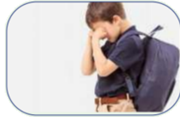
سؤال الطفل عن سبب حزنه ومحاولة مساعدته.