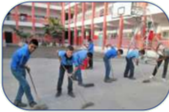
مشاركتهم أعمال التنظيف.