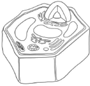
الخلية التي رسمتها منى