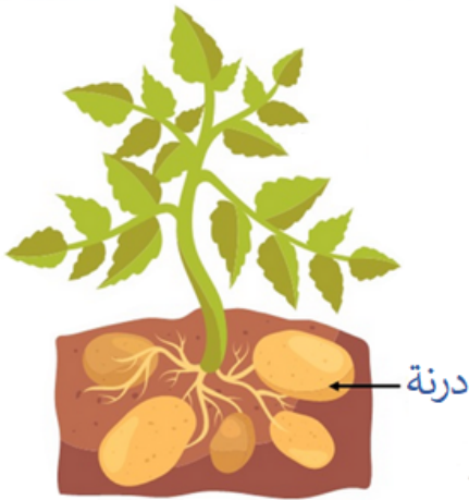
▲ نبات مكتمل