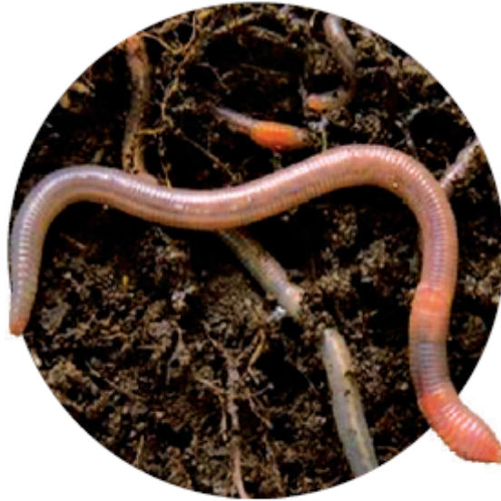
دودة الأرض من الديدان الحلقية.