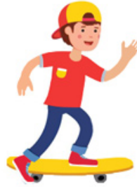
حركة لوح التزلق