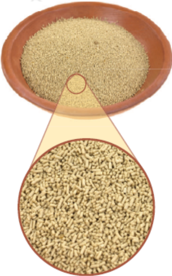
الخميرة نوع من الفطريات.