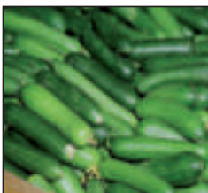
(و) .. نيئة ..