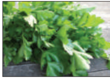
(هـ) ..... البقدونس .....