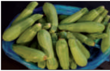
(و) ..... الكوسا .....