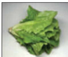
(ج) .. نيئة ..