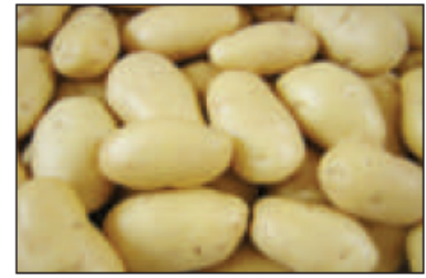
(د) ..... البطاطا .....