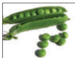
(ب) .. مطبوخة ..