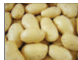
(أ) .. مطبوخة ..