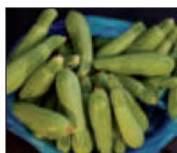
(هـ) .. مطبوخة ..