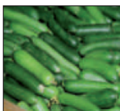
(و) .. نيئة ..