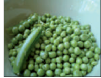
(أ) ..... البازيلاء .....