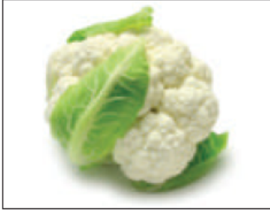
(ج) . القرنبيط . (الزهرة) ..