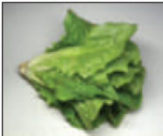
(ج) .. نيئة ..